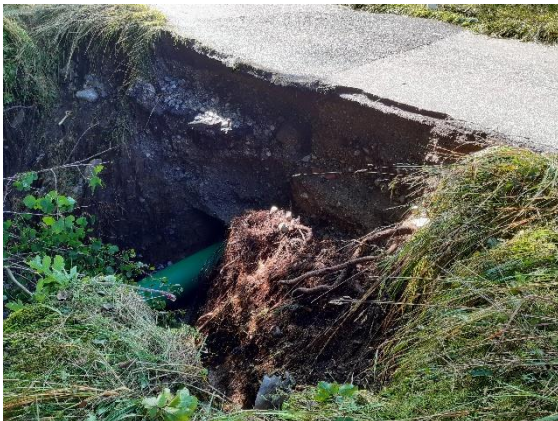
Ausgerissene, unterspülte Fahrbahnen

Die Kläranlage Irschenberg hatte eine Zulaufmenge von 900 – 1500 m 3 in 24 Stunden. Die übliche Zulaufmenge beläuft sich auf 350 m 3 . Die Pumpstationen in Wendling und Salzhub konnten das anfallende Volumen bewältigen.